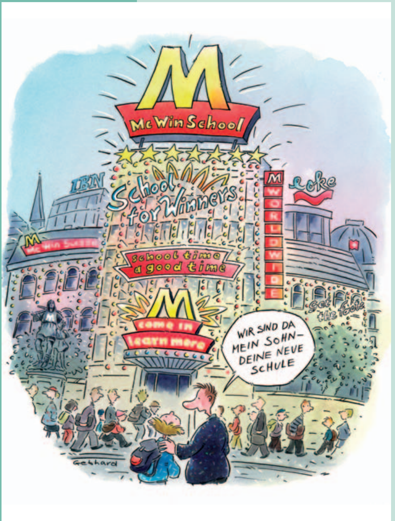
GATS könnte das Gesicht der Schule dramatisch verändern.