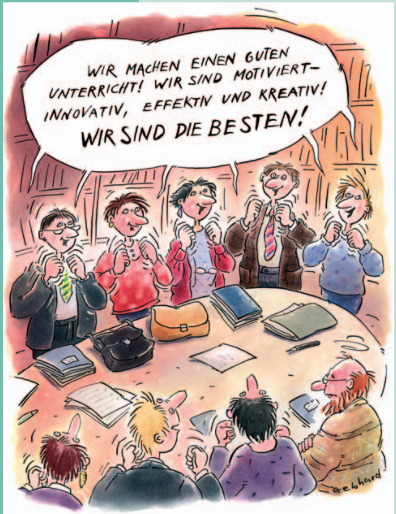
Schulentwicklungsprozesse setzen ungeahnte Energien frei.