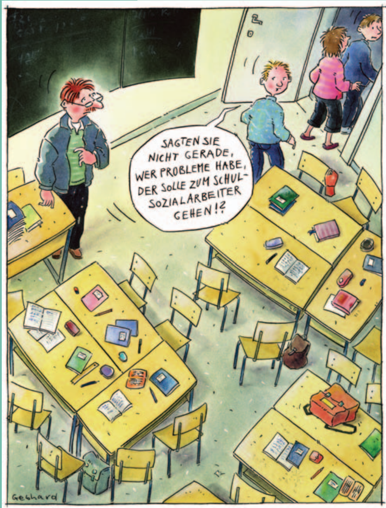
Lehrpersonen verabschieden sich zunehmend von der Rolle des Einzelkämpfers.