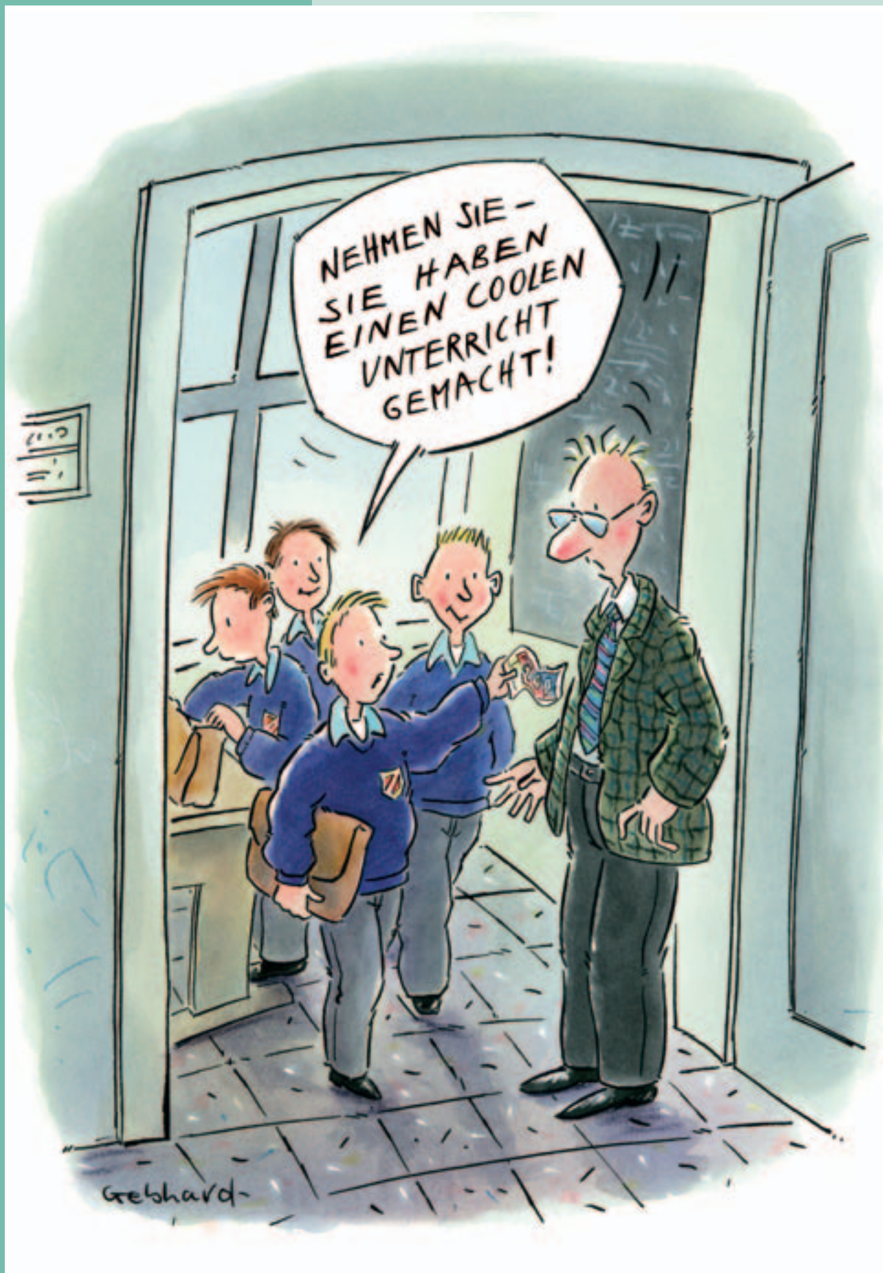
Privatschulen können besonderen Bildungsansprüchen gerecht werden.