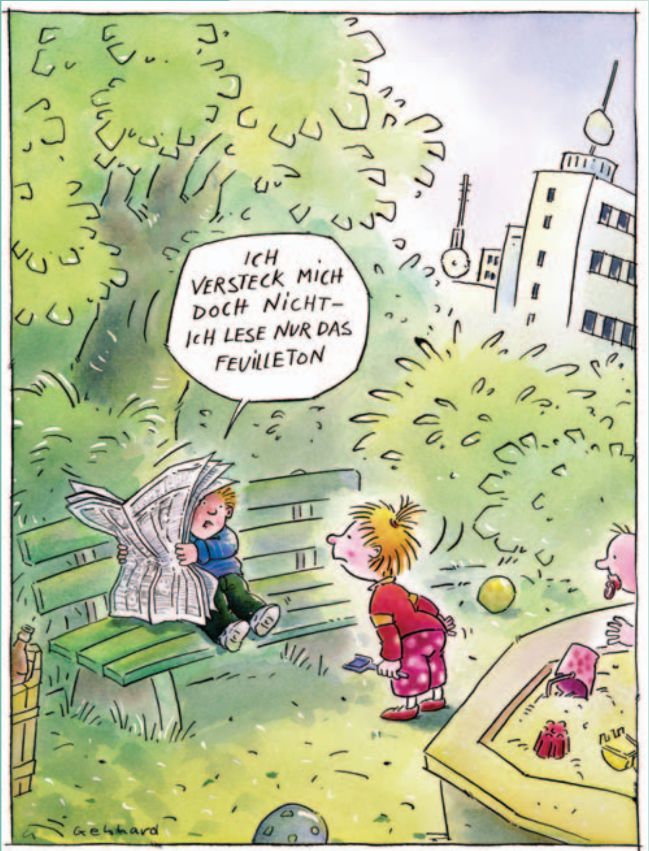
Frühe Leseförderung zeitigt erfreuliche Resultate.