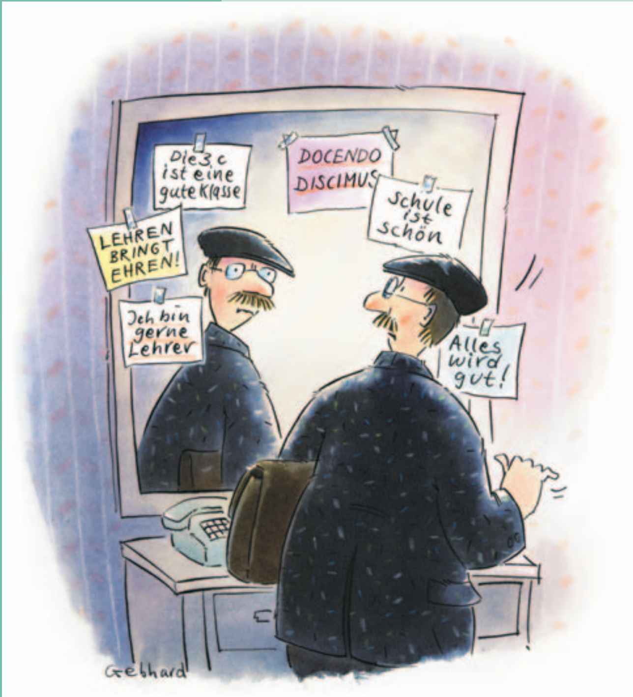
Vor dem Aufbruch am Morgen – ein Blick in den Spiegel und der Tag wird gut.

Trotz aller Schwierigkeiten ist diese Bildungsinitiative bisher ein Erfolg, und den verantwortlichen Institutionen und Personen gebührt ein Dank der Lehrerschaft für ihr grosses Engagement in diesem Bereich.