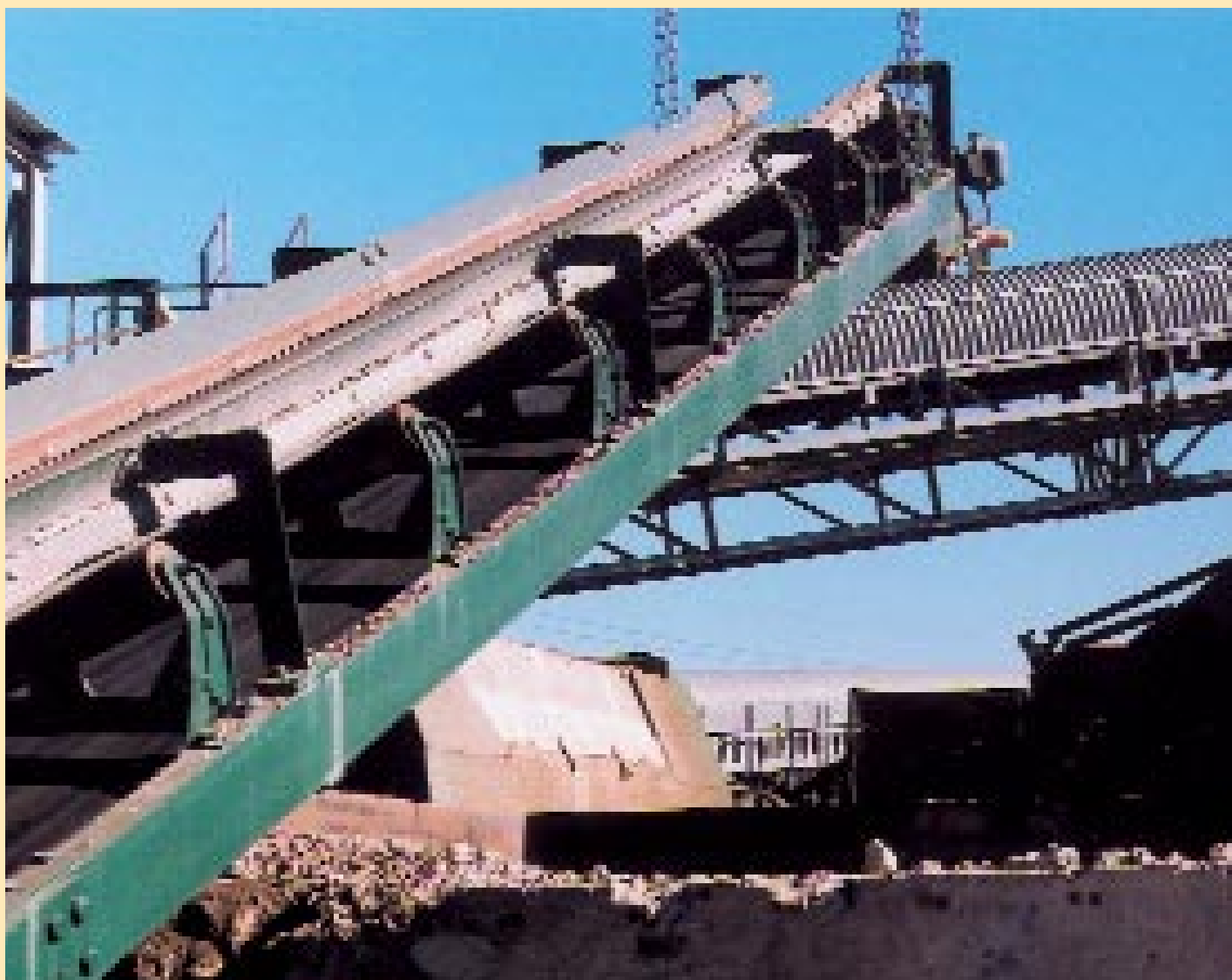
Anschlüsse gewährleistet? Noch ist viel zu klären, bis die ersten öffentlichen Grundstufen anrollen können.

Es ist nicht so, dass der Kindergarten abgeschafft wird, wie eine grosse Tageszeitung nach dem Beschluss des Kantonsrats titelte. Der Kindergarten und die erste Klasse werden zusammengeschlossen und erweitert. In dieser Stufe haben Spielen, Kreativität und Lernen ihren gleichberechtigten Platz.