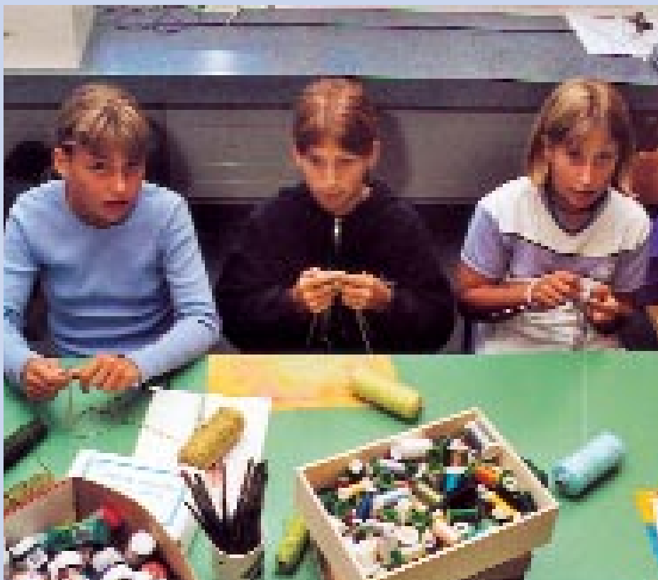
Wo und wie werden sie dereinst noch brauchen können, was sie in Fächern des Werkens und Gestaltens gelernt haben?

Die neuen Ausbildungsmodelle tendieren mehrheitlich zum Allrounder, zur Allrounderin. Die Monofachlehrpersonen verschwinden nach und nach, wenn jetzt auch niemand gezwungen werden kann, sich nachzuqualifizieren. «Es braucht die heutigen Fachfrauen weiterhin», wurde mehrmals betont. Die neu ausgebildeten Lehrerinnen und Lehrer mit Schwerpunkt Werken/Gestalten werden besser ins Kollegium eingebunden sein und damit einen besseren pädagogischen Handlungsspielraum erhalten. Das wird als Aufwertung und Stärkung empfunden.