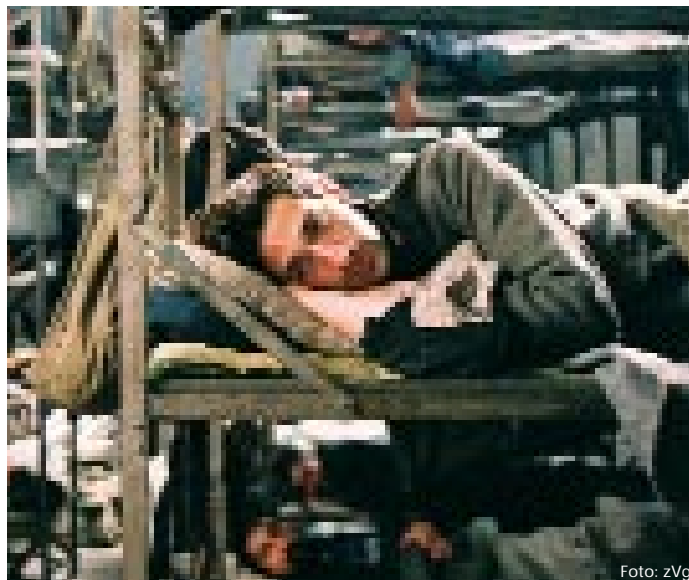
Der junge Pianist Wladyslaw Szpilman (Adrien Brody). Wie durch ein Wunder überlebt er das Grauen des Ghettos.

Nach Angaben des Verleihs sind für den Besuch des Films mit Schulklassen Sonderkonditionen erhältlich. Diese seien jedoch mit den einzelnen Kinos auszuhandeln. hw.