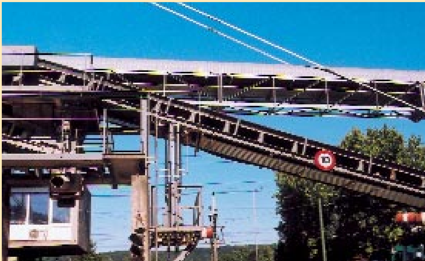
Alle übers gleiche Förderband? Die Grundstufe ermöglicht flexiblen Schuleintritt und individuelles Lerntempo.

Die traditionellen Jahrgangsklassen werden der zunehmenden Heterogenität nicht mehr gerecht. Die Grund- respektive Basisstufe fasst die beiden Kindergartenjahre und das erste respektive die zwei ersten Schuljahre zusammen. Die EDK empfiehlt regionale Versuche, doch die Kantone sind noch zurückhaltend und Pilotprojekte werden frühestens auf das Schuljahr 2003/04 lanciert.