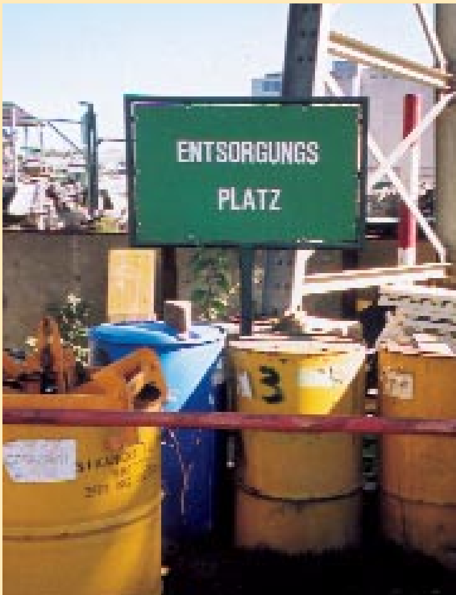
Entsorgung durch Sondermassnahmen? Grund- oder Basisstufen sollen mit speziellen Bedürfnissen besser umgehen können als bisherige Systeme.

Noch einen Schritt weiter ist der Kanton Zürich: Der Kantonsrat hat vergangenes Frühjahr grünes Licht gegeben zur Einführung der Grundstufe, welche die heutigen beiden Kindergartenjahre und die erste Klasse Primarschule umfasst. Sagen auch die Stimmberechtigten am