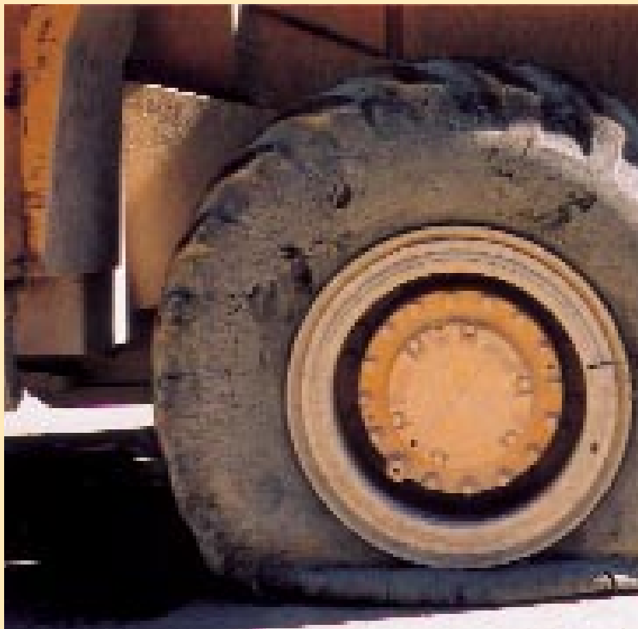
Ein Nein im Kanton Zürich wäre eine schwere Panne für den landesweiten Umbau der Einschulungsphase.