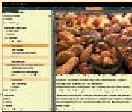
Auf multimedialer Entdeckungsreise lernen Mitspielende zum Beispiel die Brotsorten der Schweiz kennen.

Informationen und Bestellungen (Preis Fr. 59.–) via Internet: www.esspedition.ch