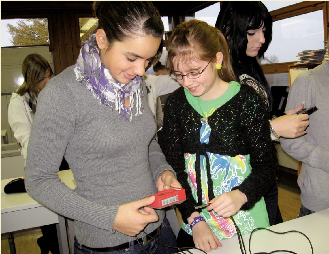
Jugendliche im Einsatz als Energiedetektive der Firma «sChOOLhouse Company».

Schulen stehen (in Deutschland) im Verdacht, schlimme «Energieschleudern» zu sein. Auch in der Schweiz können Schulen Energie sparen und damit nicht zuletzt die Klassenkassen füllen.