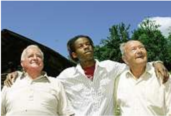
Szene aus «Un petit coin de paradis».