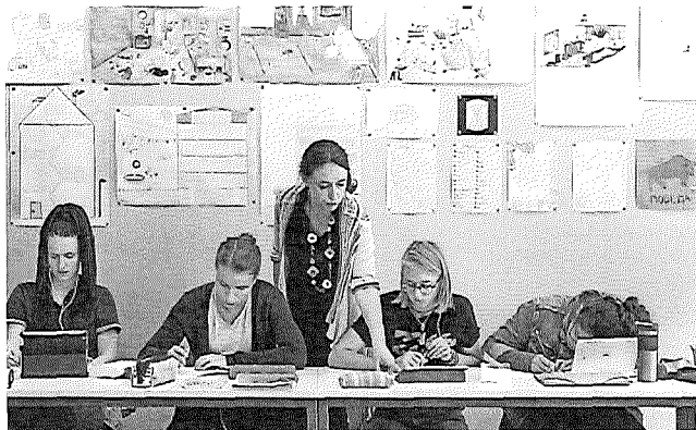
Nur ein Viertel der Lehrpersonen arbeitet Vollzeit: Französischkleton an der Kantonsschule Glarus.

Die repräsentative Studie zeigt allerdings auch auf, dass die Zahl der Überstunden seit der letzten Erhebung vor zehn Jahren deutlich gesunken ist – um