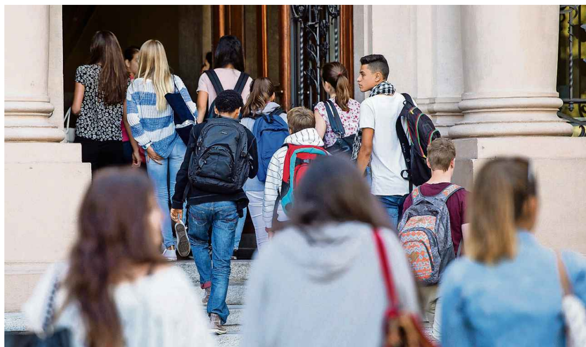
Der Andrang an den Gymnasien ist von Kanton zu Kanton verschieden.