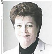
EDK-Präsidentin Silvia Steiner.

Mit einer Verlängerung des Studiums hessen sich all diese Bedürfnisse besser abdecken, sagt Schärer. Die Lehrerbildung könnte vereinheitlicht werden, was die Personalplanung der Schulen vereinfacht. Heute werden verschiedene Abschlüsse angeboten, teilweise können Fächer abgewählt werden. Akut ist darum etwa der Mangel an Französischlehrern. Als Folge