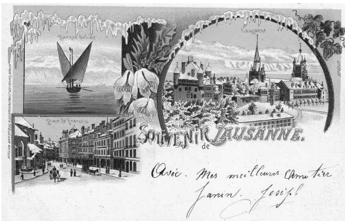
Carte postale lithographiée et publiée par H. Guggenheim & Co., Zürich, vers 1889.

Kurz: Was kann man jemandem für Ratschläge geben, der nicht weiss, wo er steht und nicht weiss, ob er nach Osten oder nach Westen gehen soll, oder doch nach Süden, oder vielleicht doch nach Norden?