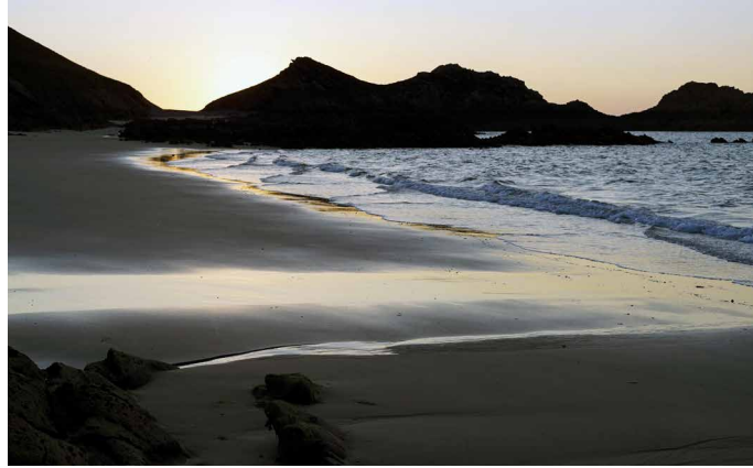
Mit etwas Glück erleben wir auch das «Meeresleuchten»