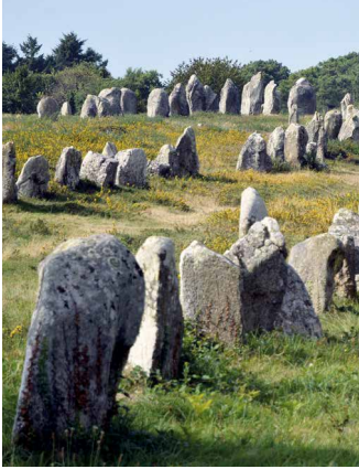
Die Menhire in Carnac