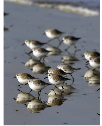
Sanderlinge im Watt

Die Nordküste der Bretagne ist geprägt von starken Gezeiten, die sich hier bis zu zwölf Meter hoch auftürmen. Dies hat Konsequenzen für Fauna und Flora, genauso aber auch für die Menschen. Die enormen Tiden legen die Strände zweimal täglich trocken und bringen die Vielfalt des Meereslebens auf dramatische Weise zum Vorschein. Zwischen den Tiden erscheinen bizarre Lebewesen auf dem Präsentierteller des freigelegten Meeresbodens. Die Landschaften der Bretagne sind abwechslungsreich und voller Dramatik. Wir reisen auf hohe Klippen, in Salzwiesen, Algenwälder und zu weiten Sandstränden. Der Meeresbiologe Thomas Jermann wird Sie in die Biologie der Gezeitenzone einführen und auf Spaziergänge auf den Meeresgrund und in die typischen bretonischen Lebensräume mitnehmen. Die steinzeitlichen Monumente von Carnac gehören mit mehr als dreitausend Menhiren, dem grössten Tumulus (Grabhügel) Kontinentaleuropas und mehreren Dolmengräbern zu den eindrücklichsten historischen megalithischen Zeugnissen.