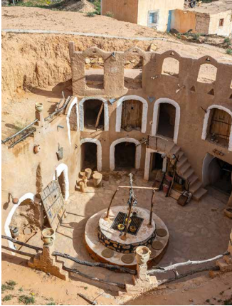
Höhlenwohnungen in Matmata