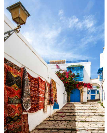
Auftakt unserer Reise: Sidi Bou Said

Antike Überreste der Kornkammer Roms, verwinkelte arabische Altstädte, islamische Wehrklöster, farbige Souks und koloniale Jugendstilfassaden – das vielfältige Tunesien lockte seit Jahrtausenden fremde Mächte an, die ihre Spuren hinterliessen. Auch Künstler wie Paul Klee waren von der Farbenpracht dieses Landes fasziniert. Erleben Sie die interessanten Gegensätze zwischen den traditionellen Städten im Landesinnern, den Berberhöhlenwohnungen im Süden und dem weltoffenen, mediterranen Tunis und machen Sie sich ein Bild über das Land, das den arabischen Frühling entfachte, eine Vorreiterrolle in der Diskussion um Frauenrechte einnimmt und Einflüsse aus den nordafrikanischen Berberkulturen mit sich trägt.