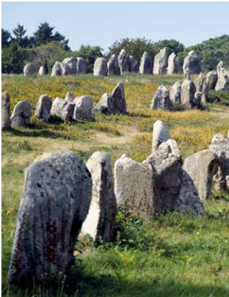
Die Menhire in Carnac