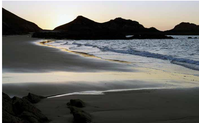
Auf einem Nachspaziergang erleben wir mit etwas Glück das «Meeresleuchten»