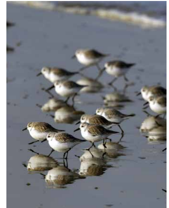
Sanderlinge im Watt

Die Nordküste der Bretagne ist geprägt von starken Gezeiten, die sich hier bis zu zwölf Meter hoch auftürmen. Dies hat Konsequenzen für Fauna und Flora, genauso aber auch für die Menschen. Die enormen Tiden legen die Strände zweimal täglich trocken und bringen die Vielfalt des Meereslebens auf dramatische Weise zum Vorschein. Zwischen den Tiden erscheinen bizarre Lebewesen auf dem Präsentierteller des freigelegten Meeresbodens.